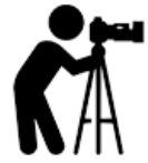
Foto- / Videobericht beim Fernempfang von Geräten

Prüfgeräte in der Werkstatt vor dem Versand