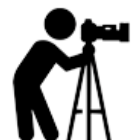
Foto- / Videobericht beim Fernempfang von Geräten

Prüfgeräte in der Werkstatt vor dem Versand